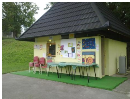
Javno stranišče na osrednjem otroškem igrišču

Razlaga ocen: 1 (zelo slabo), 2 (slabo), 3 (dobro), 4 (zelo dobro), 5 (odlično).