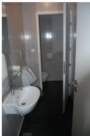
Javno stranišče za moške

Razlaga ocen: 1 (zelo slabo), 2 (slabo), 3 (dobro), 4 (zelo dobro), 5 (odlično).