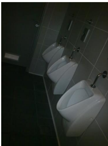
Javno stranišče za moške

Razlaga ocen: 1 (zelo slabo), 2 (slabo), 3 (dobro), 4 (zelo dobro), 5 (odlično).