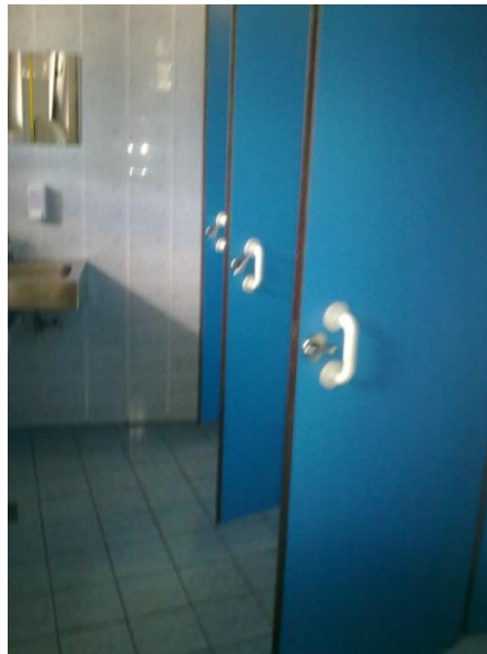
Javno stranišče za ženske

Razlaga ocen: 1 (zelo slabo), 2 (slabo), 3 (dobro), 4 (zelo dobro), 5 (odlično).