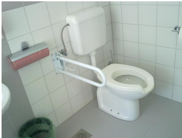
Javno stranišče za invalidne osebe

Razlaga ocen: 1 (zelo slabo), 2 (slabo), 3 (dobro), 4 (zelo dobro), 5 (odlično).