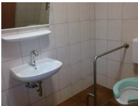
Stranišče za invalidne osebe.

Razlaga ocen: 1 (zelo slabo), 2 (slabo), 3 (dobro), 4 (zelo dobro), 5 (odlično).