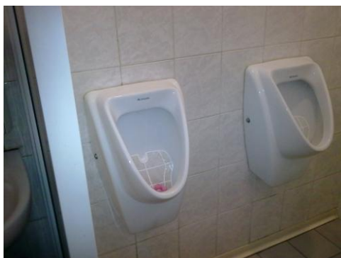
Javno stranišče za moške

Razlaga ocen: 1 (zelo slabo), 2 (slabo), 3 (dobro), 4 (zelo dobro), 5 (odlično).